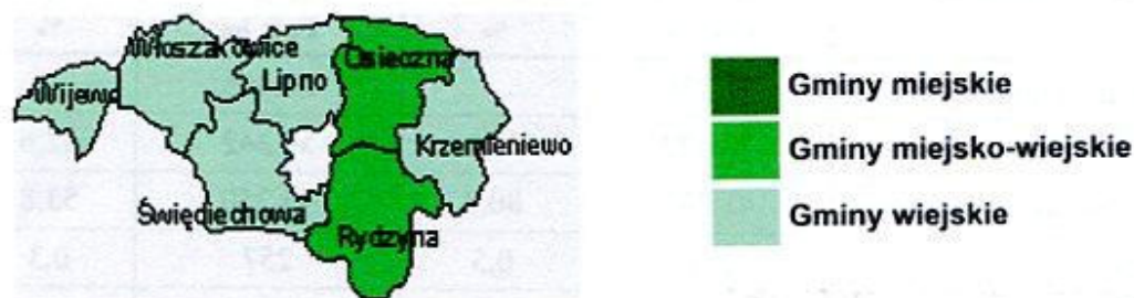
Powierzchnia (stan w dniu 1.I.2003); Ludność (stan w dniu 31.XII.2003)